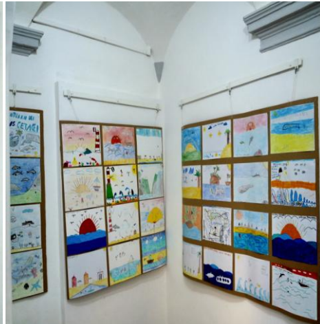
Scuola Primaria di Varazze