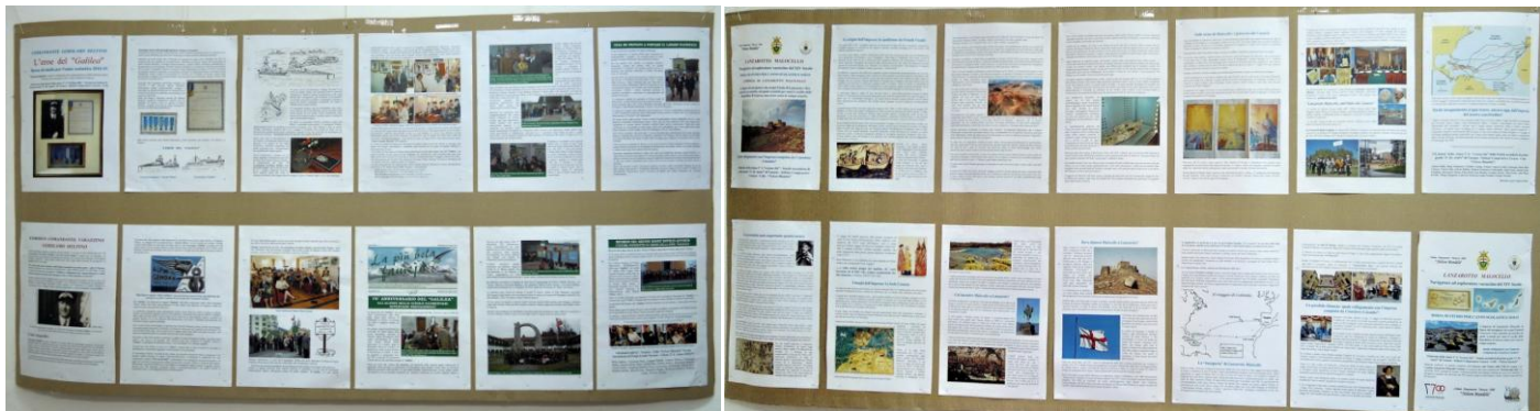
Elaborati Borse di Studio su: Comandante Gerolamo Delfino