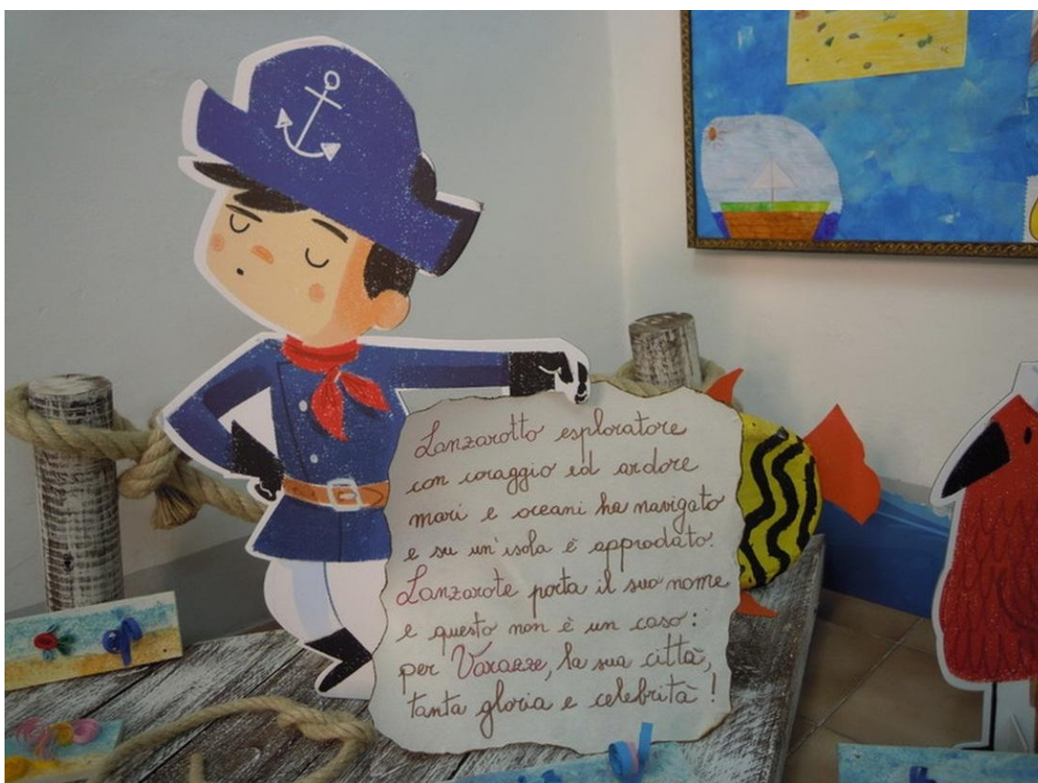
Progettato e realizzato dagli alunni della Scuola Primaria "G. Massone" per il "Lanzarottus Day" del 2018